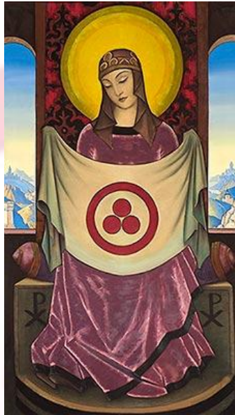
"Madonna Oriflamma, 1932" Nicholas Roerich, Museu Roerich de Nova York

Como um Tratado de União Cultural, o Pacto Roerich sugere a Bandeira da Paz como símbolo a flamular nos locais de significação cultural dos povos, sinalizando para a humanidade que ali se tratam de tesouros a serem preservados para as próximas gerações em tempos de guerra e de paz.