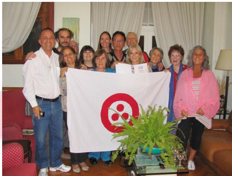
Encontro de Cultura de Paz – Buenos Aires (Abril/2011)