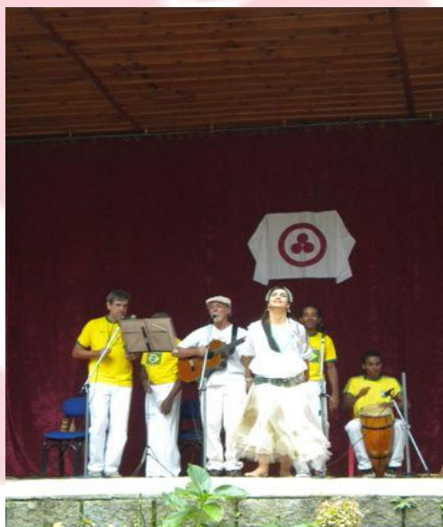
Projeto de Intercâmbio Cultural: Brasil: muitas raízes, um legado de Paz. Participação do Instituto Roerich Brasil na Celebração Anual dedicada ao aniversário de Nicholas Roerich, promovida pela International Roerich Memorial Trust, Naggar-Índia, outubro de 2011.