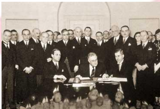
Assinatura do Pacto Roerich. 1935. Em Washington, EUA.

Na década de 30, N. Roerich agregou artistas, pacifistas, juristas e governantes do mundo inteiro em 4 (quatro) conferências internacionais dedicadas a promulgação do Pacto Roerich para proteção e preservação dos tesouros culturais da humanidade. As Conferências foram realizadas em: Bruxelas, Bélgica, 1931 e 1932; Washington, EUA, 1933 e Montevideú, Uruguai, 1933. As articulações geradas nas conferências conduziram a assinatura do Pacto Roerich pelos EUA e por mais de 20 países da América Latina em 1935, na Casa Branca, com a presença do então presidente americano Franklin Roosevelt.